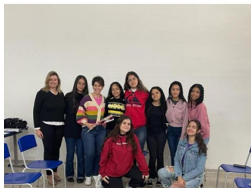
Alunos e professoras participantes do Clube do livro